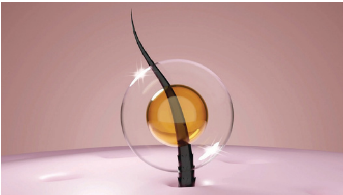
COMPLEJO PROTECTOR FLEXY SHINE