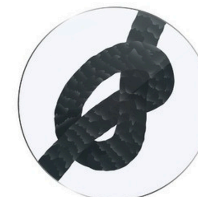
PROVA DEL NODO