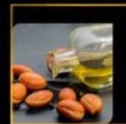
Olio di Argan